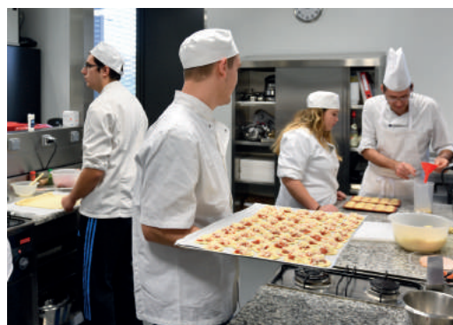
Plateau technique pâtisserie