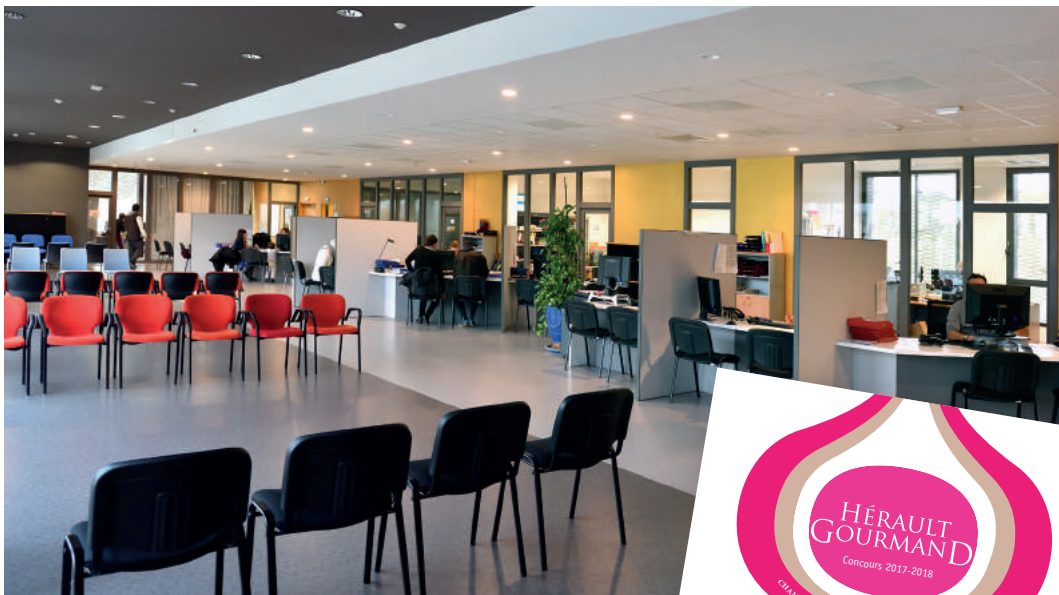
Un guichet unique pour accueillir les artisans