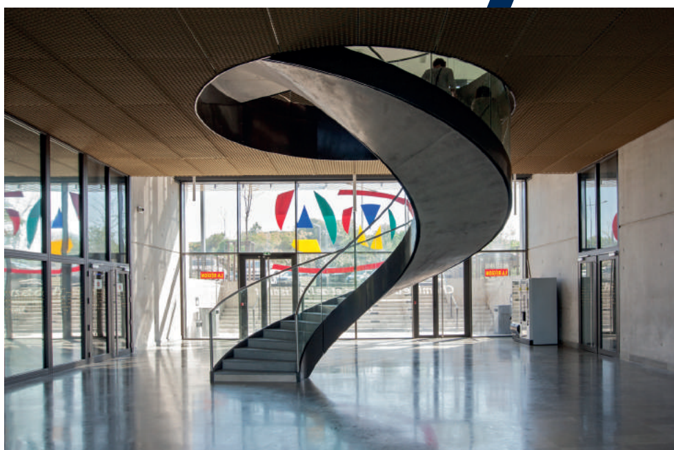
Escalier intérieur, hall d'accueil de la CMA34