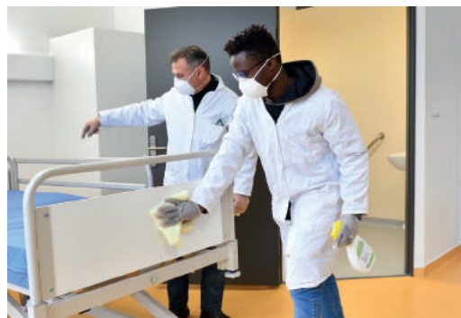
Plateau technique propreté et hygiène