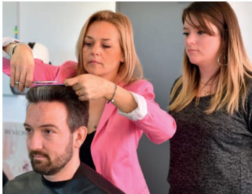
Plateau technique coiffure

Le CFA de la CMA a fait le choix de se doter de plateaux techniques de pointe. Le plateau « coiffure » recrée l'intégralité d'un salon : accueil, vente, coiffure, barbe. Il est notamment équipé de casques de séchage à technologie ionique. Le plateau « esthétique » compte 6 postes de manucure, 12 lits pour soins du corps et du visage et 6 postes de maquillage.