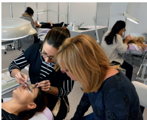
Plateau technique esthétique