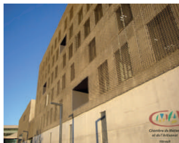
Vue extérieure de la CMA34

Ces deux parties sont unifiées visuellement et physiquement. Le bâtiment de la CMA s'intègre à son environnement. Il dialogue avec la Cité du savoir et du sport, notamment en revisitant les matériaux et couleurs du bâtiment de Zaha Hadid : béton gris clair, noir profond sur les châssis aluminium et sur les faces extrudées, et teinte dorée. La signature architecturale, avec sa résille en métal déployé et doré, permet une identification immédiate de la CMA.